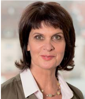
Вера Райсс Министр образования, науки, повышения квалификации и культуры