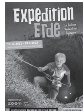
Das Plakatmotiv zur Ausstellung.

Weitere Infos unter: www.expedition-erde-ausstellung.de